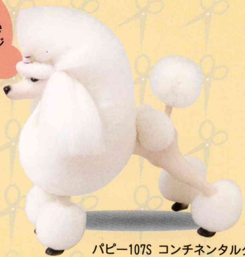
パピー107S コンチネンタルタイプ